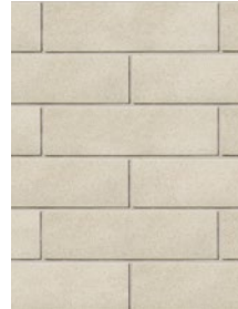
BLANC POLAIRE / POLAR WHITE Dimensions : 168 x 590, 257 x 590