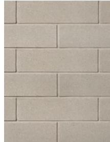
DOVER Dimensions : 168 x 590, 257 x 590, 290 x 590