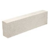
Pierre 168 x 590 Longueur 590 mm (23 1/4 po) Hauteur 168 mm (6 5/8 po) Profondeur 90 mm (3 1/2 po) S'imbriquent harmonieusement avec Premier Plus et Artiste 2