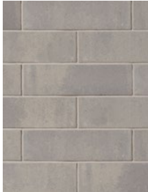
GRIS STRATUS / CLOUDBURST Dimensions : 168 x 590, 257 x 590

Toutes les couleurs dans les dimensions illustrées sont en stock. Fabriqué dans notre usine de Brampton, Ontario.