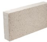
Pierre 290 x 590 Longueur 590 mm (23 1/4 po) Hauteur 290 mm (11 3/8 po) Profondeur 90 mm (3 1/2 po) S'imbriquent harmonieusement avec les briques et les blocs métriques