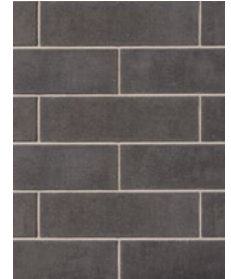
CRÉPUSCULE / TWILIGHT Dimensions : 168 x 590, 257 x 590