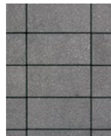
FINI FERRO, CRÉPUSCULE NOUVEAU!

Finis Ferro, Crépuscule : Finis antidérapant, idéale pour délimiter et les accents en soldats.